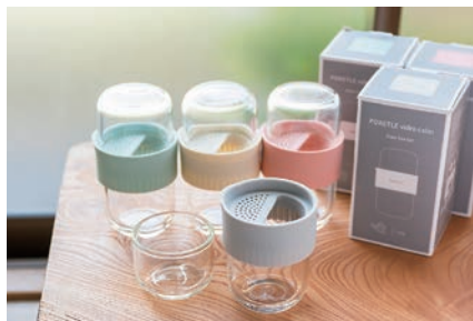
哲郎さんがプロデュース支援した ブランド・POKETLEのガラス製きゅうす