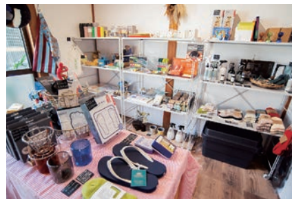
個性的な雑貨が並ぶ店内の様子

もなかったご近所さんたちと、お店を通じてコミュニケーションが取れています。それから、お店同士のつながりも貴重です。私たちのお店があるエリアは、徒歩圏内にお店が点在する散策にちょうどいい場所で、お店同士でショッピングカードを置き合ったりしてお客さんを紹介し合っています。実際に来てくれるお客さんの中には、別のお店から「近くに雑貨屋があるよ」と紹介されて来てくださる方もたくさんいらっしゃいます。