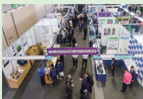
ビジネス交流フェア

京都府内に主たる事務所を置く中小企業組合の設立や、業界振興、共同事業を通じて組合員の経営の安定や基盤強化、販路開拓など支援を行っています。中小企業・小規模事業者の様々な経営課題（金融・税制、雇用・労務、情報化、生産性向上など）についても相談に応じています。また、組合等青年部の若手経営者等を中心とした京都青年中央会、組合等女性部や事務局職員・事業所等の女性経営者等を中心とした京都府中小企業女性中央会などの運営も行うほか、企業間・業界間連携を促進しています。