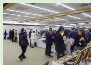
助け合い隊異業種交流会

この事業では、組合・組合員が抱える「お困りごと」の解消、技術や商品のPR、各種イベントの周知などを柱として、イベントや勉強会の開催、専門家派遣、事業継続などの情報提供も行っています。