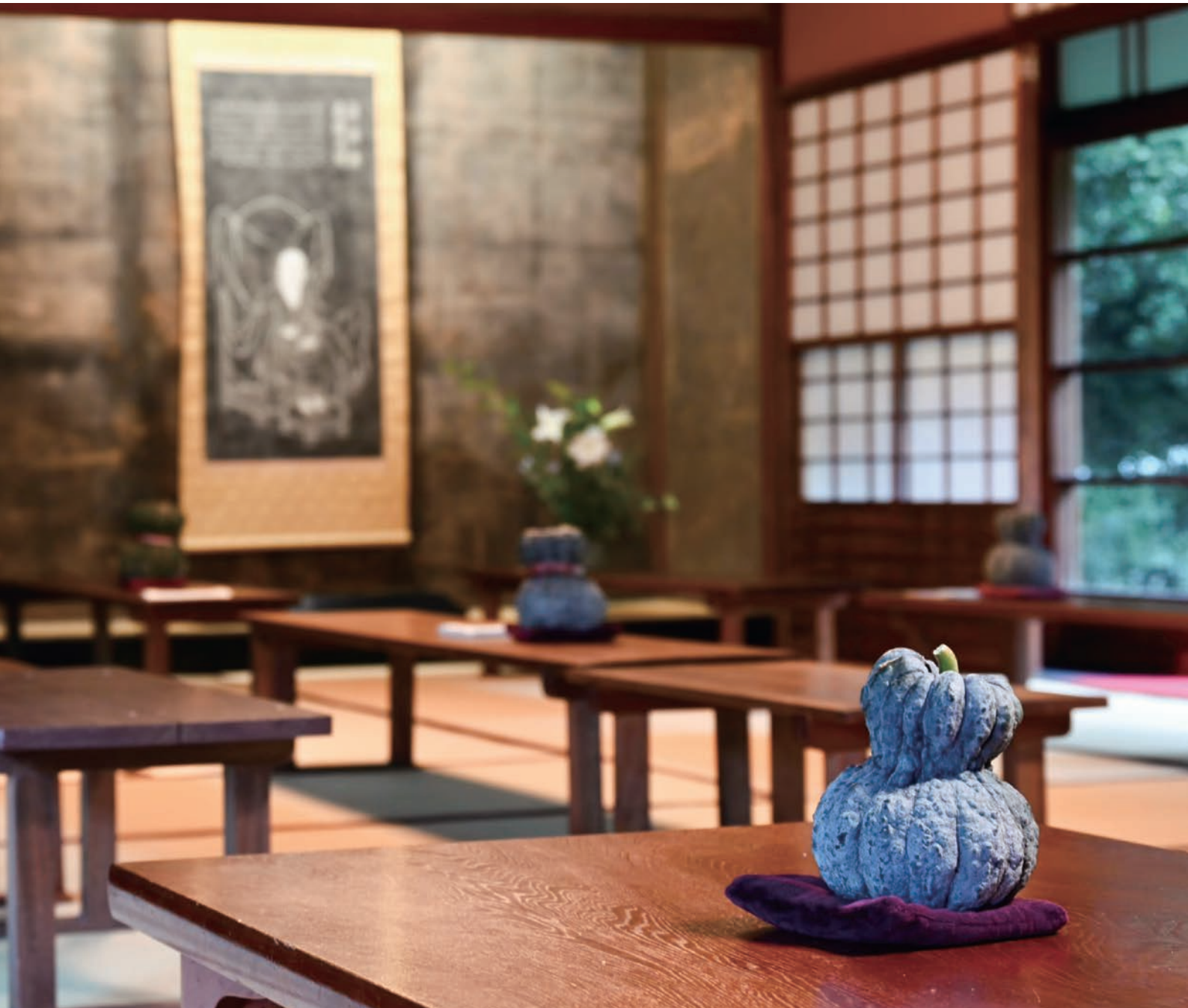
安楽寺 かぼちゃ供養