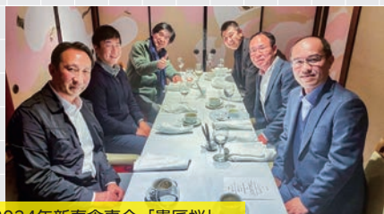
2024年新春食事会「真匠桜」

農業、食品業界全般に対して適切なアドバイスとバックアップができる診断士を目指すため、会員相互の交流と診断士のスキルアップ及び知識の向上を行う場を提供することを目的としています。